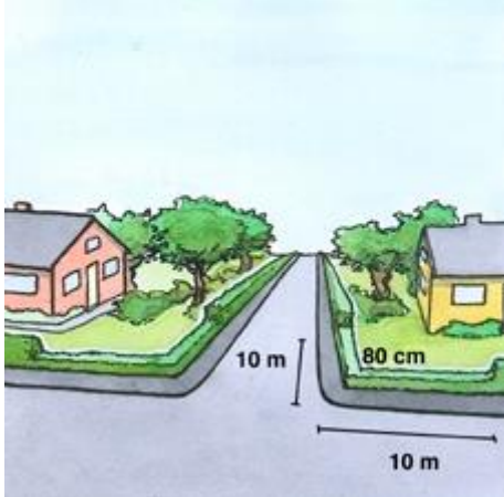
Nr 1 - Om du har hörntomt

Låt det gärna växa och grönska, men inte på trottoaren! Enligt plan - och bygglagen, har du som fastighetsägare vissa skyldigheter att hålla efter växtlighet som hänger ut på trottoaren.